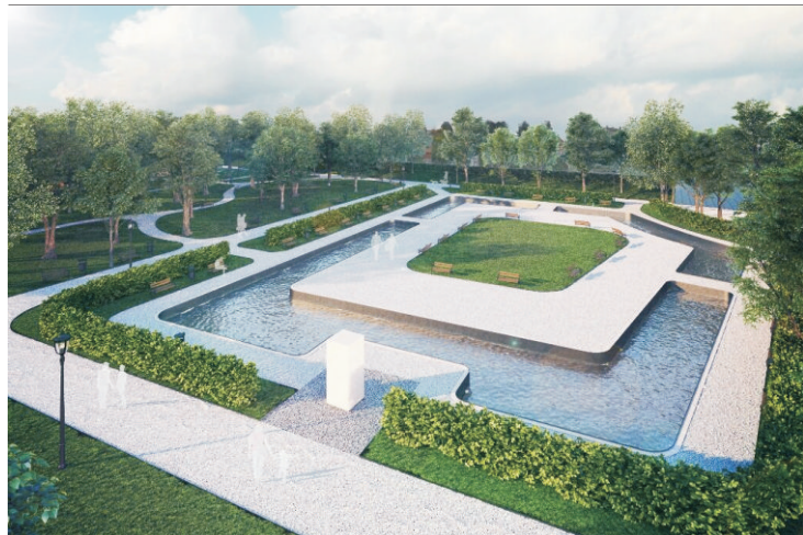
FONTANNA, PLANTY – WIZUALIZACJE UM BOCHNIA