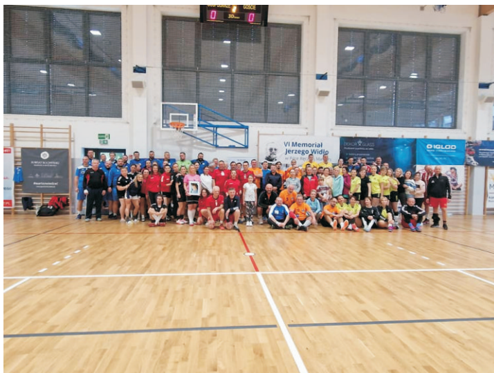
ZDJĘCIE: RPA BOCHNIA HANDBALL TEAM