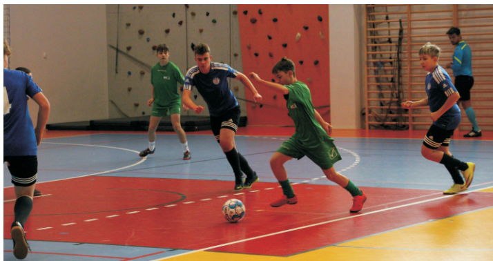
ZDJĘCIE: PPN W BOCHNI